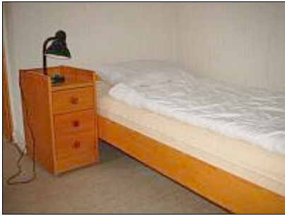
Das Leiterzimmer ist mit einem Bett, Telefon und separater Dusche/WC ausgestattet