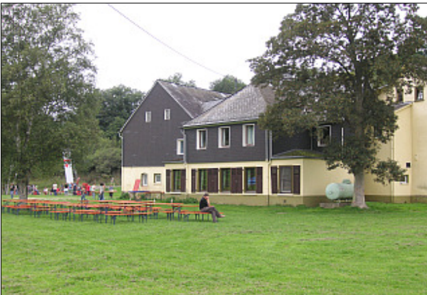
Das Gelände am Haus bietet Platz für vielfältige Aktivitäten