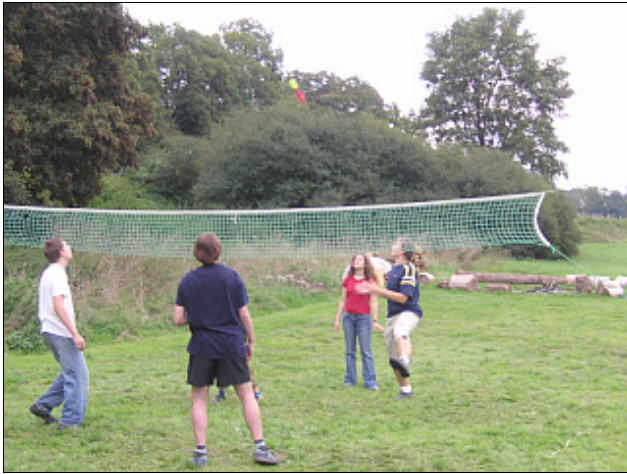
Beim Indiaca-Spiel hinter dem Haus