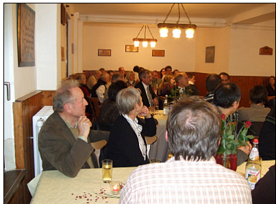
Der Speisesaal verfügt über eine Durchreiche und einen direkten Zugang zur 2010 vollständig renovierten und modernisierten Küche

Auf den Wiesen zwischen Klingelbach und Ergeshausen, 15 km südlich von Limburg, liegt am Eingang eines stillen Taunustales das Freizeitheim Lindenmühle. Seit vielen Jahren finden hier Freizeiten, Seminare und Treffen des Christlichen Vereins Junger Menschen (CVJM) statt, und einer ganzen Generation von jungen Menschen ist die Lindenmühle zur zweiten Heimat geworden.