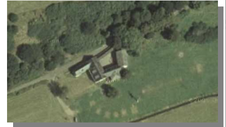
Luftbild der Lindenmühle Auf der Wiese kann man noch sehen, wo im letzten Sommer Zelte gestanden haben.

Schulstr. 1 56348 Bornich Tel.:06771/7021 Januar 2008